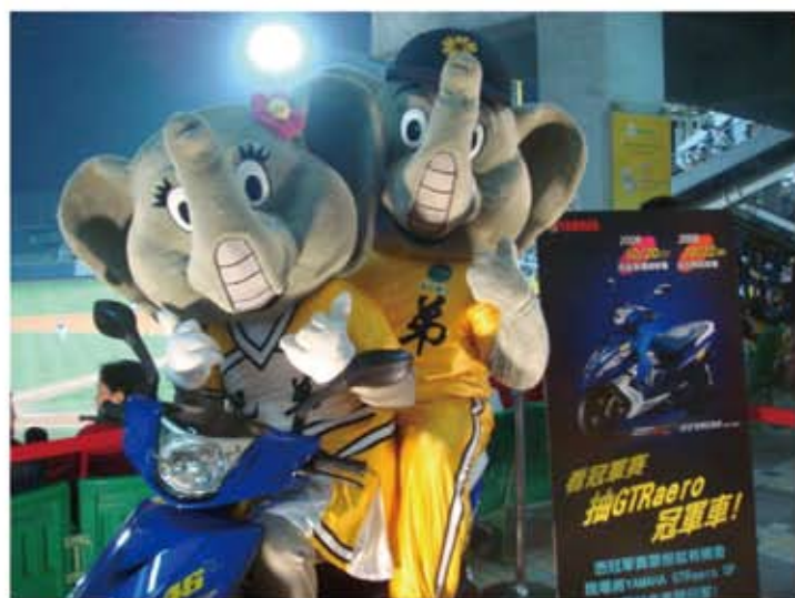
↑→於球場展示商品，並搭配可愛的吉祥物，是球迷爭相拍照的畫面。

利用球賽現場，用最貼近球迷的方式，於球場內外擺設各式廣告物，營造出企業日的熱鬧氛圍，加深現場球迷對品牌之印象。