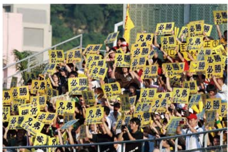
● 加油紙板、加油扇或紀念毛巾，是球場常見也是球迷最喜愛的應援道具。

企業主題日或球隊活動時，發送應援道具或紀念贈品，與球迷一同營造主場優勢，印有企業Logo的加油道具和贈品也將一併成為球迷的收藏品，宣傳效果佳。