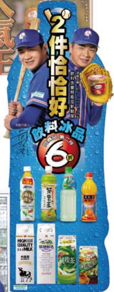
2008年穿著奧運隊服的恰恰代言全家2件恰恰好，圖為人形立牌和店內製作物。