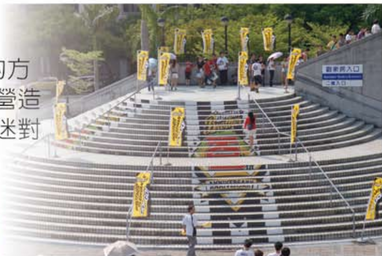
↑於球場大量佈置企業旗幟，更有助於營造主題日氣氛。