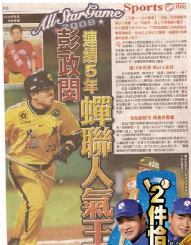
↑ 2008年蘋果日報體育版大篇幅的報導。